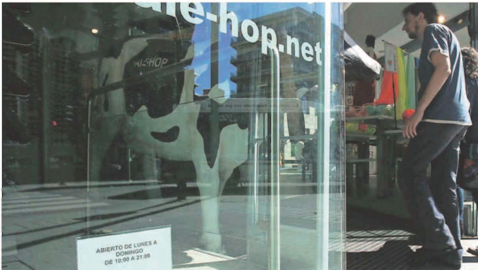
Un comercio de la plaza de España muestra su horario de apertura en el escaparate.