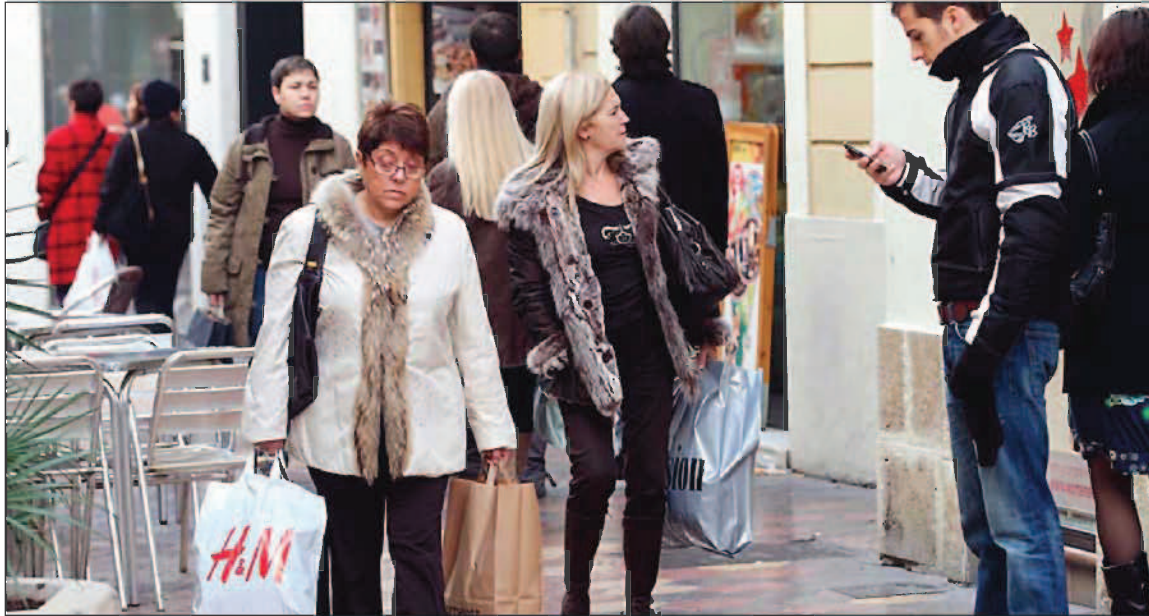
Todos los indicios apuntan a una recuperación del consumo en Navidad. J. LUCAS